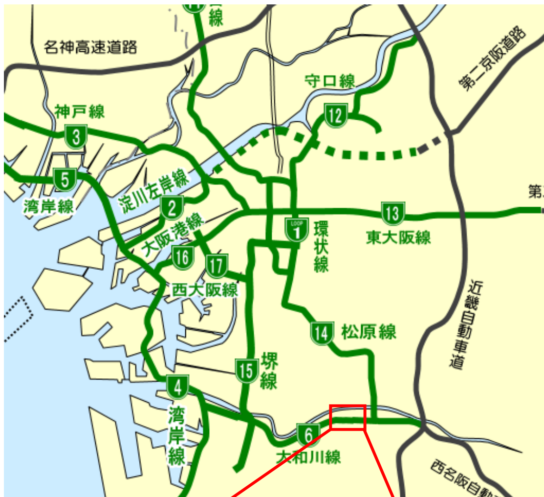
三宅西本線料金所