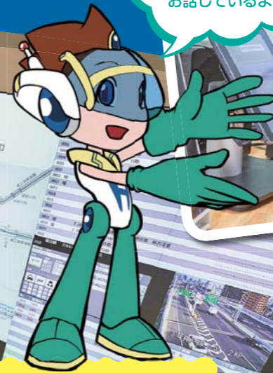
こう つう かん せい いん 交通管制員

あ! こうつうかんせいいん 交通管制員さんが、 パトロール隊員さんと お話しているよ!