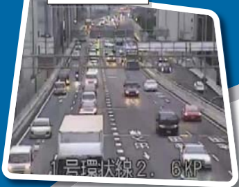
えい そろ カメラ映像