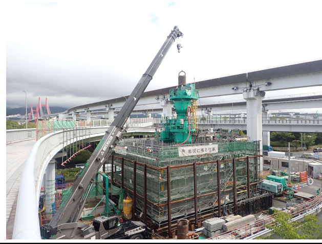
【1】橋脚(PPE-7)ニューマチックケーソン基礎工事において、4口目目の沈下掘削完了。