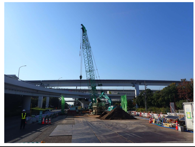
【1】橋脚(PPE-6)における地中障害物撤去状況。