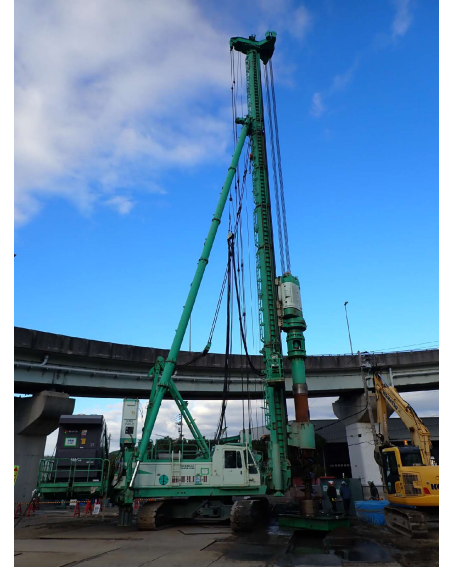
【3】橋脚(PPE-2)基礎工事に於いて、鋼管矢板継手部の先行削孔状況。