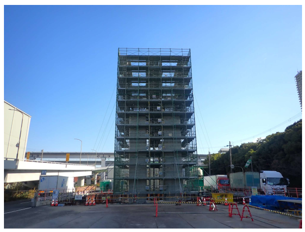
【1】橋脚(PE-1)における橋脚構築状況。