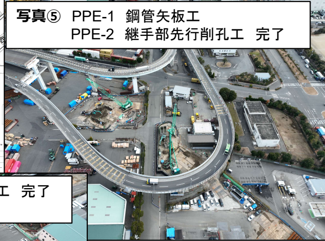
写真⑤ PPE-1 鋼管矢板工 PPE-2 継手部先行削孔工 完了