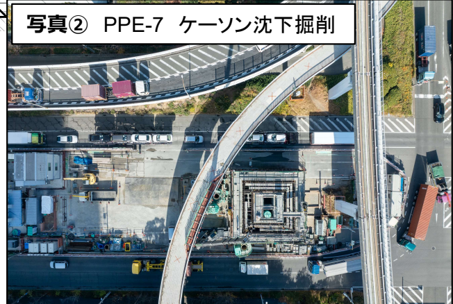
写真② PPE-7 ケーソン沈下掘削