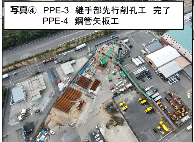
写真④ PPE-3 継手部先行削孔工 完了 PPE-4 鋼管矢板工