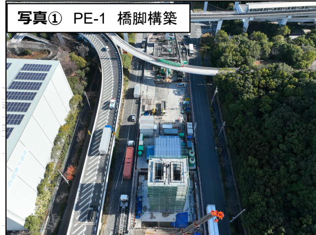
写真① PE-1 橋脚構築