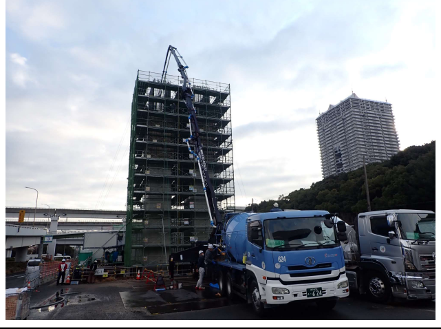
【1】橋脚工事(PE-1)における、橋脚のコンクリート打設状況。