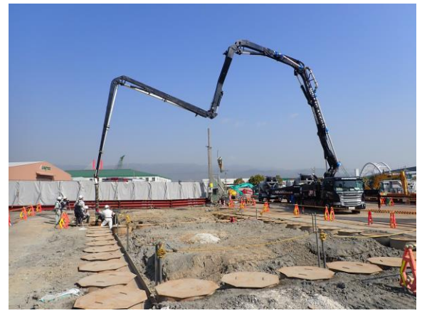
【3】橋脚工事(PPE-4)における、鋼管内へのモルタル打設状況。