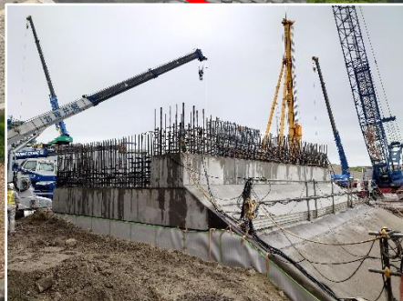
③換気塔部の躯体工