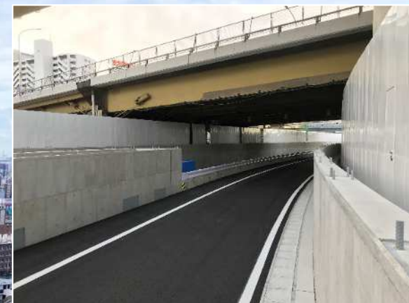
②盛土部舗装工完了