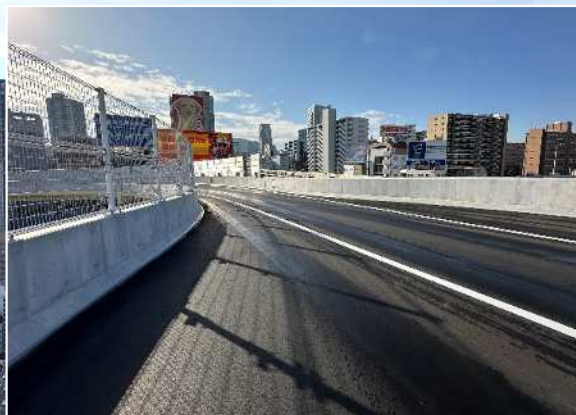
①橋梁部舗装工完了