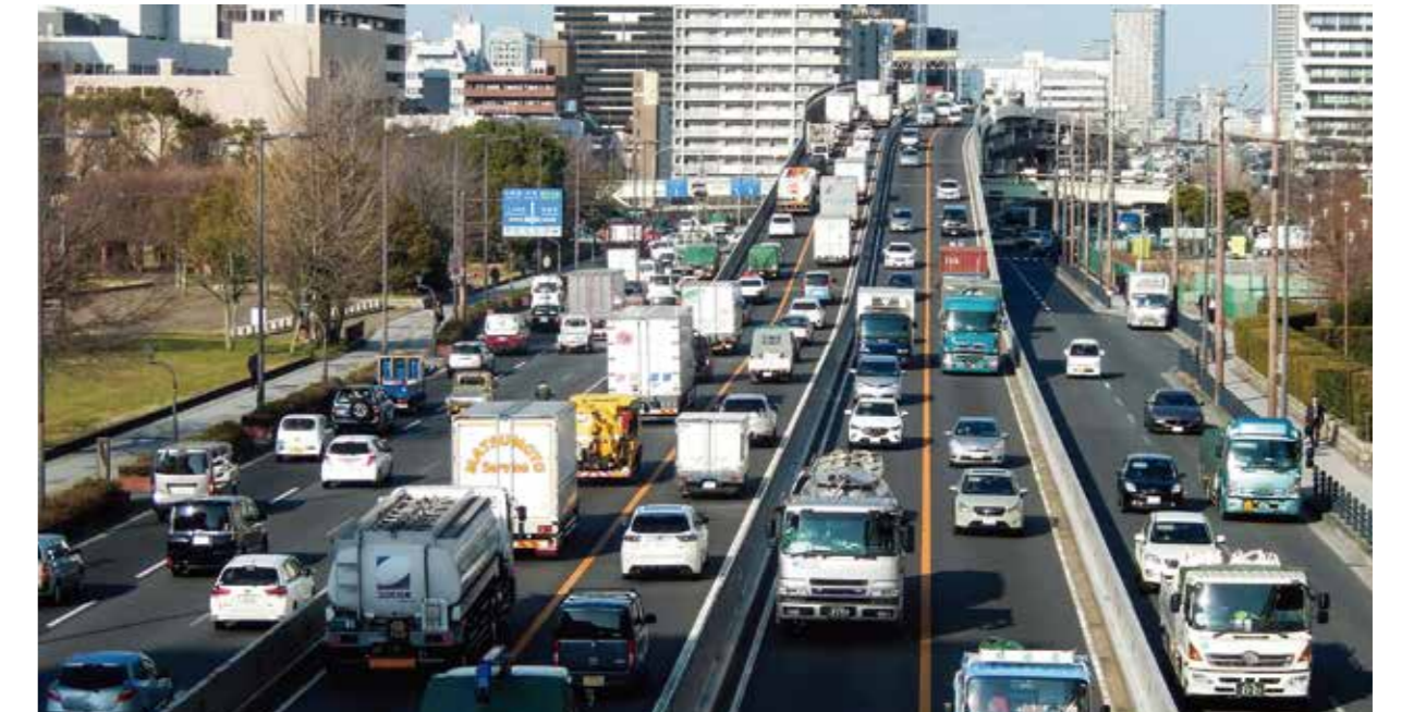
※阪神高速13号 東大阪線 大阪城付近

阪神高速1号環状線 利用車両1日31万台の内、 大阪都市圏に用事のない 車が 10万台(31%) も流入！