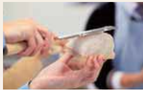
魚のすり身を板に盛ってかまぼこの原型を作ります。

練り物製品でおなじみの「カネテツデリカフーズ」が若い世代に伝統の味を知ってもらおうとオープンした、かまぼこちくわの手作り体験施設です。大人もお子さまも思わず真剣になってしまう体験に、ぜひご参加ください。