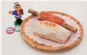
自分で作ったちくわとかまぼこは格別! ズが買える直売店も。