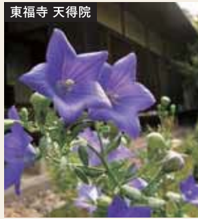
上品に咲く桔梗の花を愛でながら ゆったり静かな時間を味わえる