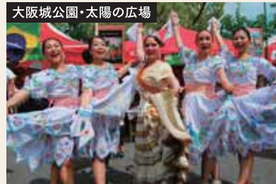
大阪城公園・太陽の広場