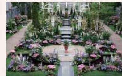
◎淡路花博15周年記念事業実行委員会事務局 ☎0799-74-5466 公式HPは「淡路花博2015」で検索