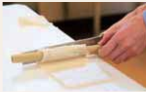
すり身をシート状にして焼き棒に巻き付けます。

ちくわ・かまぼこ手作り体験施設 てっちゃん工房 手作り体験コース(かまぼこ・ちくわ) ※所要時間約90分 時間/10:00~、13:00~、15:00~ ※前日までに要予約 料金/1,200円(税込) アクセス/5号湾岸線六甲アイランド北出入口より5分 ☎078-857-3453(平日8:30~16:30)