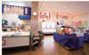
工房内には、練り製品やオリジナルグッズが買える直売店も。