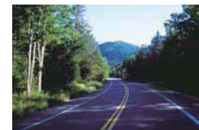
旅の行程や見逃した運転中の風景も、映像で鮮明に残せます。

ドライブレコーダーは、万が一に備えて走行中の画像を自動的に撮影する装置ですが、ドライブの思い出づくりにも活用できるのをご存知ですか? ドライブレコーダーは事故やトラブルを記録したり、安全意識の向上につながるのと同時に、楽しい旅の思い出を残す便利なツールとしても活用できます。車載カメラが記録したドライブの行程を家に帰ってテレビで再生すると、運転に集中して見られなかった風景を家族みんなでゆっくりと楽しむことができます。GPS機能付きのタイプなら場所や日時もしっかりと残せます。最近では機能も向上し、価格もさらに手頃になりました。ドライブレコーダーで旅の思い出を残してみたい方が多いでしょう。