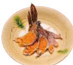
うな重(赤だし付)花 3,000円 ふなずし1,000円 (一定3,000円より) 鰻刺身 650円。