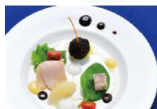
コンテッサ2,700円[オードブルバリエ/日本の温製スープ/お魚料理orお肉料理/デザート/パンorライス/コーヒーor紅茶]

フレンチレストラン ベル ヴァン ブルージュ ■大津市柳が崎5-35びわ湖大津 館1F ☎077-511-4180 ■10:00 ~21:00 / ランチ11:00~14:00 / ティナー17:00~21:00(L.O. 20:00) ■あり(柳が崎湖畔公園有 料駐車場をご利用ください。●施設 ご利用で3時間無料) ●地図はP4 参照。