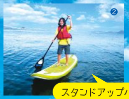
スタンドアップパドル