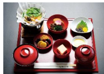
体験とお料理のお問い合わせ・お申込みは 延暦寺会館 ☎077-579-4180 (9:00~17:00) ■根本中堂より徒歩約2分

山野のめぐみを中心とした 賞味いたります。●比叡御 ●事前にお申し込みください。