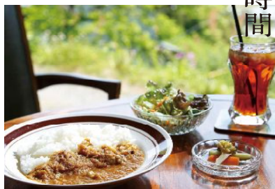
定番キマツカレー 930円(サラダ・ピクルス付) [+ドリンク1,280円~] 国産の黒毛和牛をしっとり煮込んだ味わいと野菜の甘みが香辛料の風味を引き立てます。ハンバーガーや月経リランチもおすすです。

棚田のある風景とのんびり時間 cafe&gallery キマツシ 懐かしい我が家に帰ったみたいにくつろげ、また来たくなる古民家カフェ&ギャラリー。のどかな風景を見ながら、手づくりのパンやお食事、スイーツなど季節にあわせた味を楽めます。アート志向のイベント・ワークショップなども自白押し!