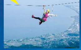
ジップラインアドベンチャー