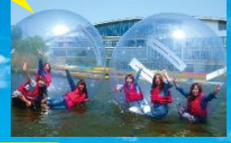
ウォーターボール

琵琶湖畔のアウトドアスポーツ施設で、充実した避暑の時間が過ごせます。話題のウォーターボールをはじめ、カヤックなどの定番まで、初心者向けスクールが充実しています。