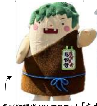
多可町観光 PR マスコット「たか坊」