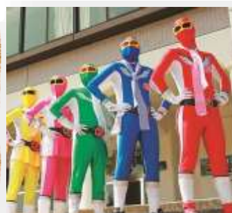
多可町ご当地ヒーロー「タカレンジャー」