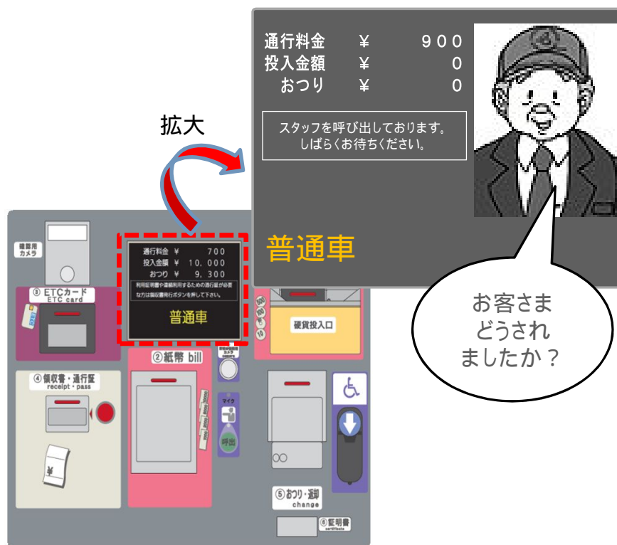
自動収受機接客部(イメージ)

自動収受機設置レーンは、『一般』または『ETC / 一般』で運用します。『ETC / 一般』をETC車で利用される場合は20km/h以下でレーンに進入し、開閉バーが開いたことを確認して走行してください。